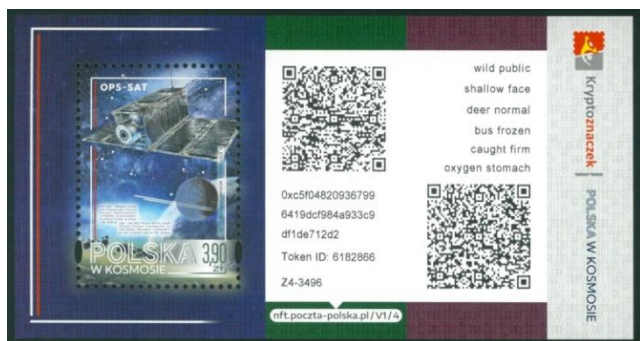
il. 2. Skan bloczka kryptoznaczkę (walor fizyczny) z wydania Polska w Kosmosie , kategoria 4, nr kat. 5275II. Po prawej stronie nadrukowano informacje potrzebne do zarządzania NFT.

do jego unikatowych właściwości. Każdy taki token jest w pełni rozróżnialny od innych tokenów tej samej klasy. To tak jak numer seryjny na znaczku pocztowym, banknocie czy na tablicy rejestracyjnej samochodu. Podobnych przedmiotów jest wiele, jednak ten konkretny egzemplarz jest jedyny w swoim rodzaju – to istota NFT. Niestety dla wielu często kojarzonego z prymitywnymi obrazkami w internecie, które kosztując duże pieniądze reprezentują niestabilną wartość spekulacyjną. Z uwagi na to, nieliczni zdają sobie sprawę, jak duży potencjał aplikacyjny tkwi w NFT oraz jak może to zmienić przyszłość kolekcjonerstwa. Wielu operatorów pocztowych dołączyło już do innowacyjnego grona emitentów nowoczesnych znaczków pocztowych, które posiadają dołączony swój odpowiednik NFT, a więc kryptoznaczków. Nasz polski operator Poczta Polska S.A. wydaje kryptoznaczkę od 2022 roku.