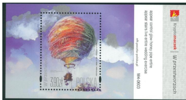
il. 3. Skan bloczka kryptoznaczkę (walor fizyczny) z wydania W Przeszłości , kategoria 4, nr kat. 5354III. Po prawej stronie nadrukowano informacje potrzebne do zarządzania NFT.